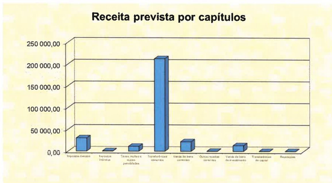
Gráfico n.º 1- receita prevista por capítulos